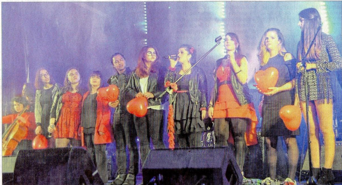
Les Poupées Rouges ont invité le Mas Band sur scène pour chanter « Imagine » en mémoire des victimes des attentats de Paris.

et de son rock alternatif pour faire grimper la température alors que la foule se faisait de plus en plus dense.