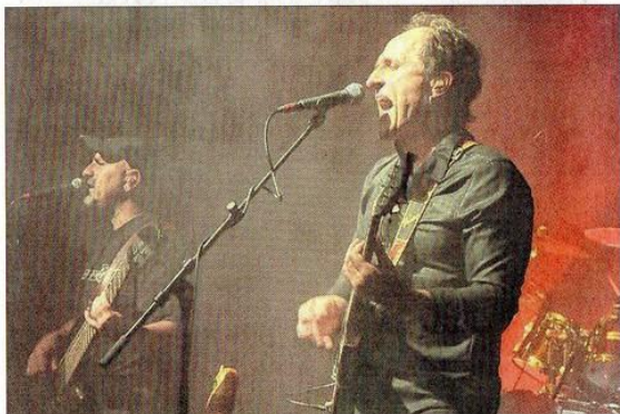
Le groupe phare des années 1980 Gold revient à Altkirch, six ans jour pour jour après avoir déplacé les foules, c'était lors de l'édition 2009.

Y ALLER Vendredi 12 et samedi 13 juin, à partir de 20 h, sur la place Xavier-Jourdain, devant la Halle au blé d'Altkirch. Accès libre et gratuit. Buvette et restauration sur place. Site web : www.festival-amitie.com