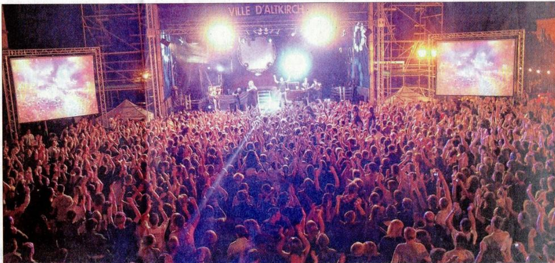
Une place de la Halle au blé noire de monde : un spectacle qui se reproduit chaque année grâce aux bénévoles de l'association altkirchoise Music Art System.