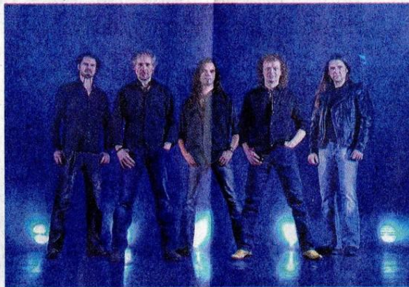
Purple Rising, tribute to Deep Purple, jouera vendredi soir.

Il a 10 ans déjà, ce Festival de l'Amitié ! Il a offert sa scène à bon nombre de groupes nationalement reconnus, comme Manau (en 2010 et en 2013), Gold (en 2009), Michael Jones et Soldat Louis (en 2011), Julie Pietri (en 2012), mais aussi à de nombreuses formations en devenir, comme Last Train ou Haute Fréquence, ainsi qu'à des « Tributes » aussi incroyables les uns que les autres.