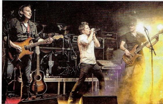
New Jersey, formation allemande spécialisée dans les reprises du fameux groupe de rock et heavy américain Bon Jovi, sera la tête d'affiche du vendredi soir.