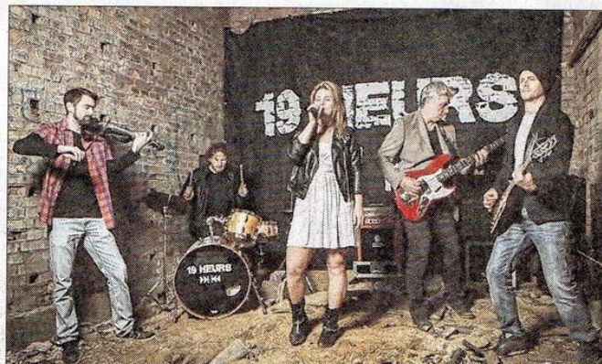
Le groupe 19 Heurs, à découvrir sur scène le vendredi 9 juin. DR

Pour ouvrir les hostilités, le vendredi soir, on pourra d'abord compter sur le rock « nerveux et chevelu » du quatuor mulhousien Stone cox. Suivra le groupe 19 Heurs et son mélange de rock, folk et pop servi par une voix féminine étincelante. Une formation qui avait déjà fait parler d'elle aux Pot'Arts de Tagolsheim. La fête se poursuivra entre rock et électro avec les Bas-Rhinois de