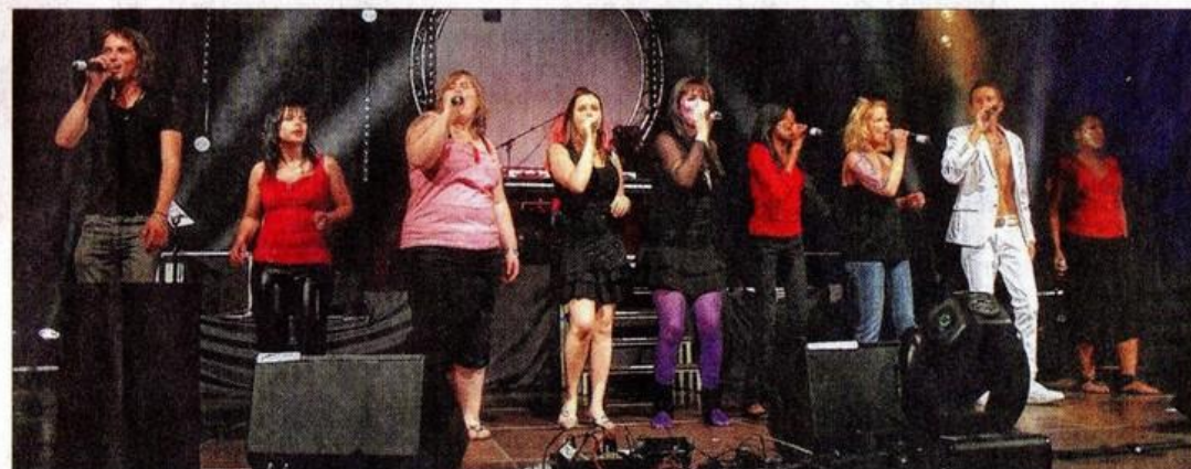
Les voix du Mas Band assureront le show le 28 mars prochain à Wittersdorf.

PRENDRE DATE Samedi 28 mars, à partir de 19 h, à la salle polyvalente de Wittersdorf. Tarifs : 20 € avec repas (carpes frites ou collet fumé, café, dessert), 12 € pour les moins de 12 ans et 10 € sans le repas. Renseignements et réservations au 03.89.08.85.35 ou par courriel : comite@musicartsystem.com