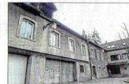
L'association a jusqu'à la fin du mois pour quitter le bâtiment de la rue Traversière.