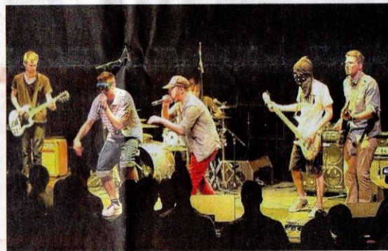
Rock et hip-hop réconciliés avec Ask, qui viendra de Haute-Marne.