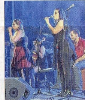
Rock et glamour avec les Poupées rouges.