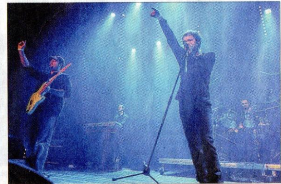
Punishment Park, des Belges spécialisés dans les reprises d'Indochine.