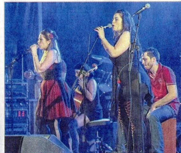
Le charme et les voix envoûtantes des Poupées Rouges, locales de l'étape.